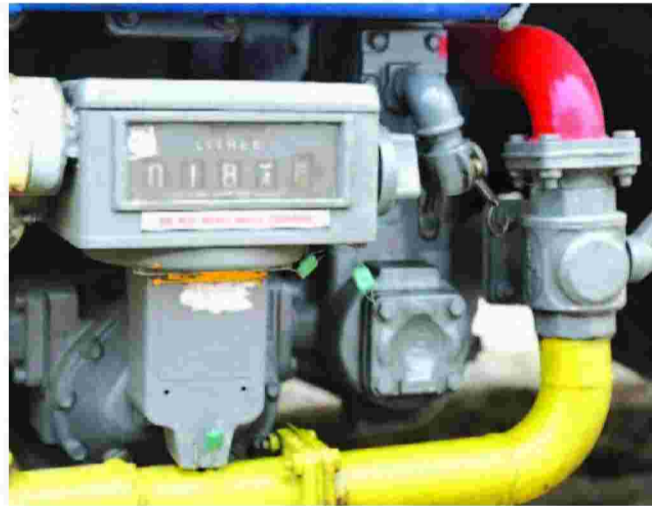
Η επιδότηση ανά λίτρο αγοραζόμενου πετρελαίου θέρμανσης θα είναι μειωμένη από 0,25 σε 0,125 ευρώ.

μος, το Αγαθονήσι, τα Λέβια, το Καστελόριζο (ή Μεγίστη), οι Αρκίοι, η Μάραθος, το Γυαλί, η Τέλενδος, το Φαρμακονήσι, η Κίναρος και η Στρογγύλη. Τα 6 νησιά στα οποία οι συντελεστές ΦΠΑ θα αυξηθούν από την 1η-7-2018 είναι η Λέσβος, η Χίος, η Σάμος, η Κως, η Κάλυμνος και η Λέρος.